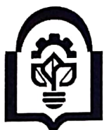
مرکز رشد واحدهای فناور دانشگاه دامغان